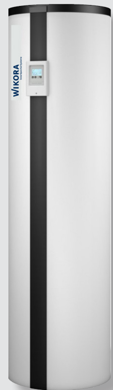
WIKOSUN LiSa 121-12

*Abhängig von Inhalt und Druckverlust von Rohrnetz, Kollektoren und Wärmetauscher